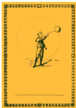
БУКЛЕТ: K. MEIZTER — Travelling Light — CD (Horus CyclicDaemon, 2006)